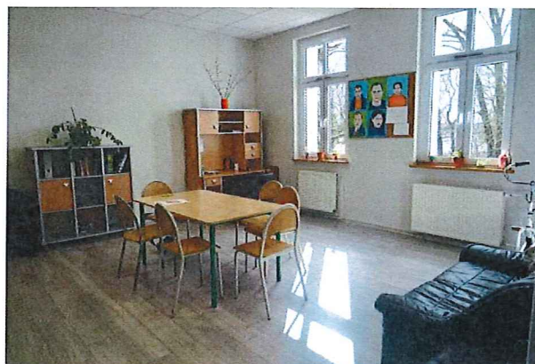
Sale wielofunkcyjne w ŚDS

2. Proszę opisać wybrany JEDEN przykład współpracy jednostki samorządu terytorialnego z organizacjami pozarządowymi, grupami nieformalnymi, mieszkańcami, który był realizowany w 2022 r. i dotyczył wsparcia obywateli/obywaterek Ukrainy w związku z konfliktem zbrojnym na terytorium tego państwa, z uwzględnieniem kryteriów wskazanych w regulaminie w § 9, ust. 2. (max. 1 strona). Dodatkowo należy wkleić w tekście materiały potwierdzające zrealizowane działanie np. aktywny link (hiperłącze), zdjęcie/a, zrzuty ze stron internetowych, itp.