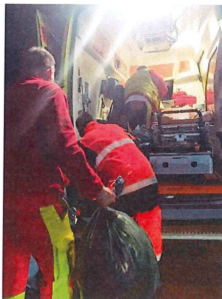
Przekazanie darów przez Chojeńską Grupę Ratowniczo – Poszukiwawczą

Ponadto Powiatowe Centrum Pomocy Rodzinie oraz Regionalne Centrum Kryzysowe w Myśliborzu – jednostki organizacyjne powiatu nawiązały współpracę z grupami nieformalnymi z Berlina (Niemcy) i Kopenhagii (Dania) którzy dostarczyli dużą ilość darów.