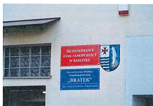
Budynek Środowiskowego Domu Samopomocy w Barlinku