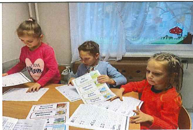
W poszukiwaniu skarbów jesieni