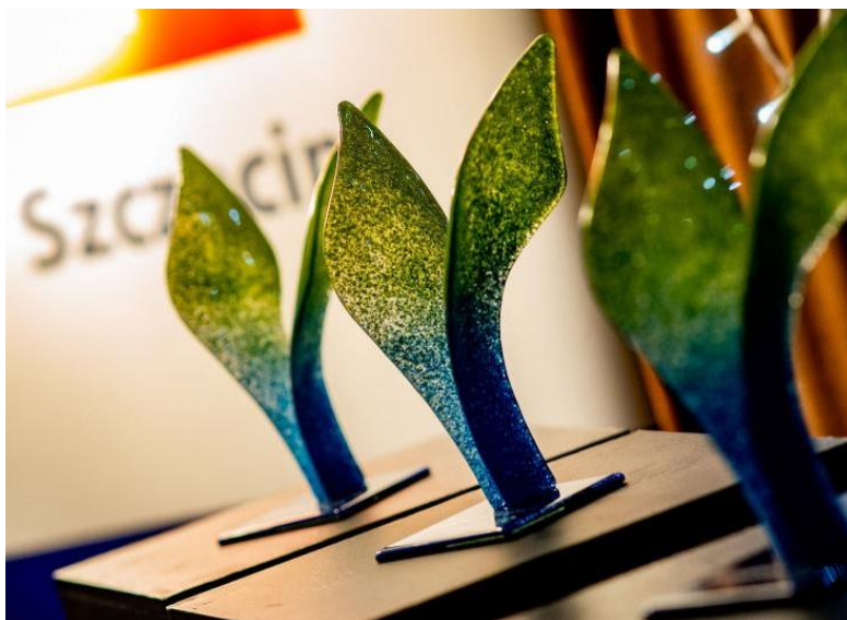
Fot. Statuetka Plebiscytu Pozarządowy Szczecin 2022.

Nagrodami – wyróżnieniami były bony o wartości 800 zł z przeznaczeniem na sfinansowanie potrzeb (celów statutowych), wskazanych przez organizację/grup nieformalną (wzrost o 100% w stosunku do poprzednich lat). Poza nagrodą pieniężną laureaci otrzymali statuetki, a niespodzianką była produkcja krótkich materiałów filmów o wyróżnionych inicjatywach (w załączeniu do niniejszego formularza)