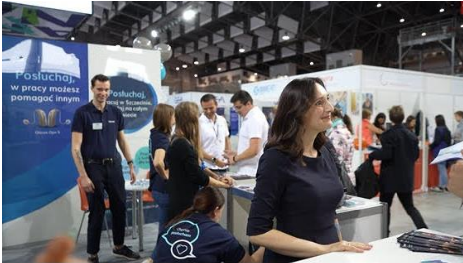
Fot. Kadr z filmu XVII Targi Pracy Szczecin

3. Kategoria Projekt Społeczno-Obywatelski - zadanie/inicjatywa/działanie/ akcja skierowana na przeciwdziałanie skutkom inwazji zbrojnej w Ukrainie: wsparcie uchodźców, organizacji oraz społeczności lokalnych.