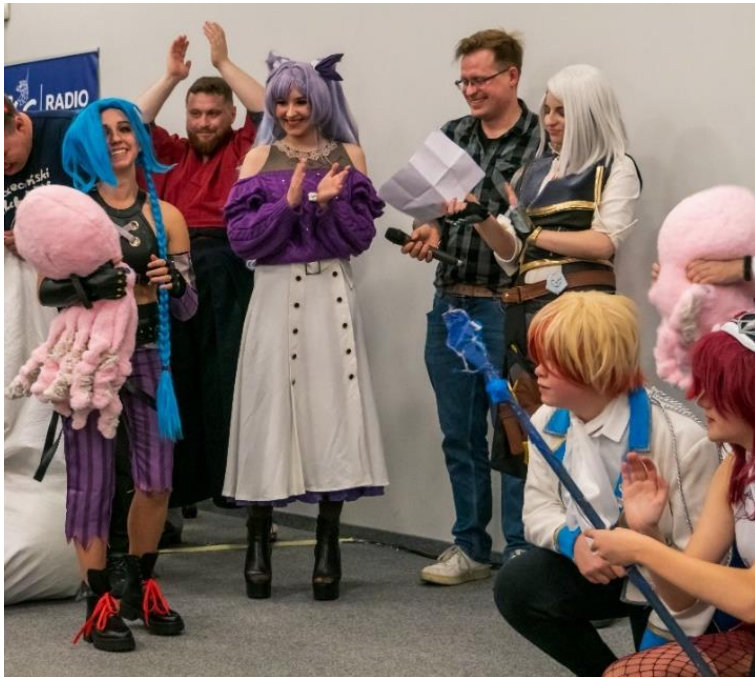
Szczeciński Klub Azji, zadanie pt. „Japan Fest 2022”