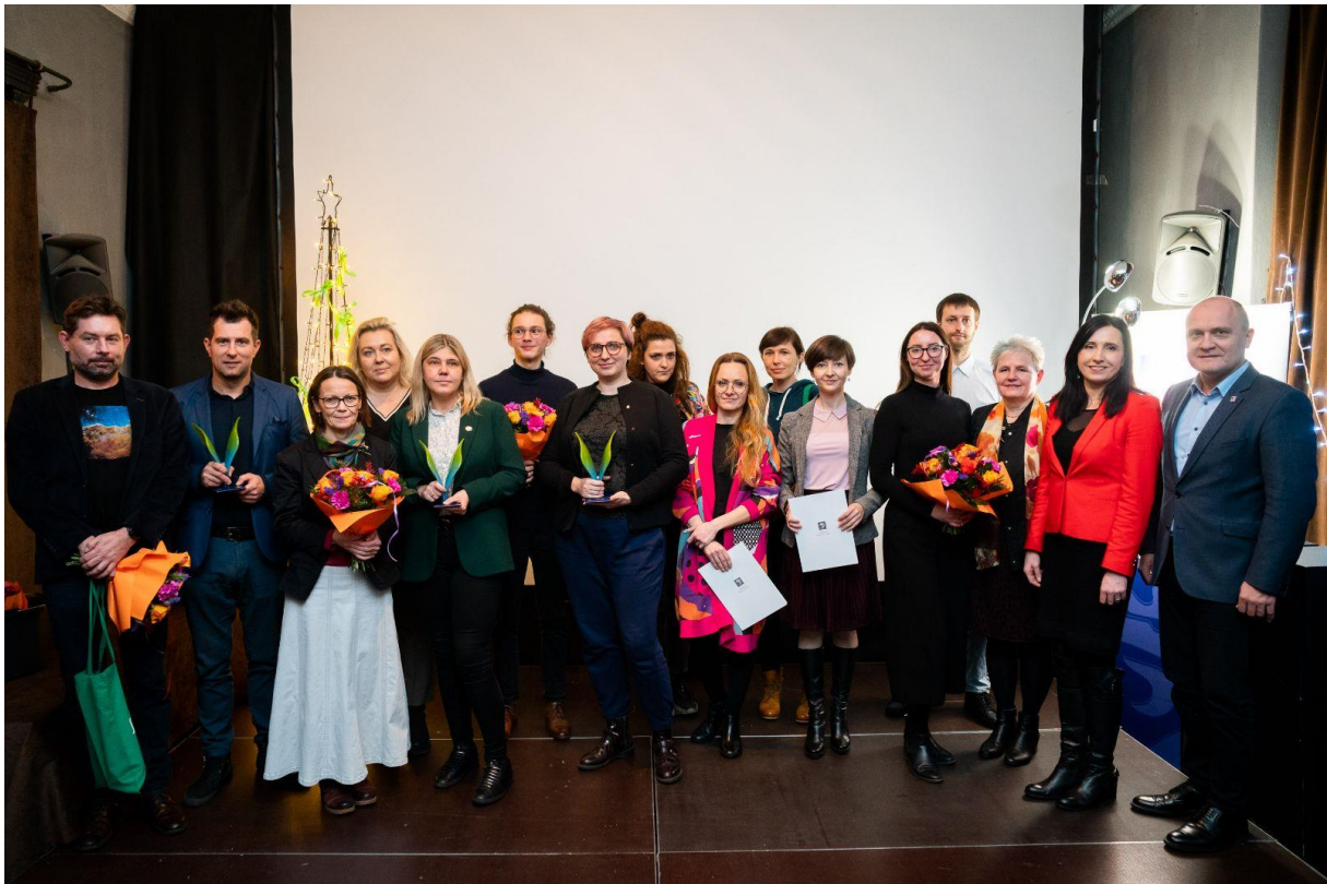
Fot. Laureaci oraz wyróżnieni plebiscytu Pozarządowy Szczecin 2022.

Link do Biuletynu Informacji Publicznej Urzędu Miasta Szczecin z Ogłoszeniem Otwartego Konkursu ofert: