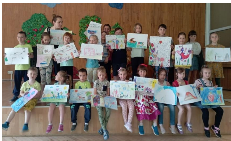
Fundacja Prawobrzeże, zadanie pt. „Odkrywczy talentów”