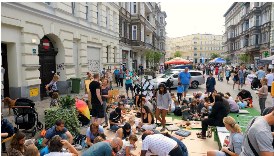
Fot. Kadr z filmu Rajskie Dni na Rayskiego